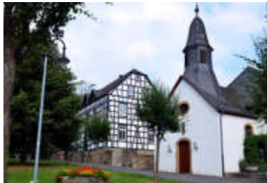
Kirche u Bürgermeisteramt